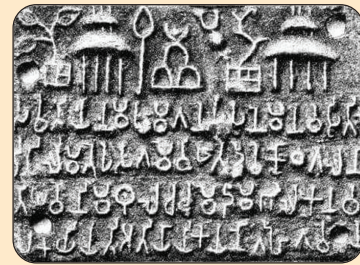
સોહગૌરા તામ્રપત્ર, ઉત્તરપ્રદેશ

કાલાંતરે સંસ્કૃત લેખનની શરૂઆત કુશાણ કાળમાં થઈ. તે પૂર્વે સંસ્કૃત ભાષા શ્રુત-શ્રવણ સ્વરૂપમાં દૃઢ હતી. અશોકના સમયમાં સંસ્કૃત શિલાલેખોમાં અવતરિત ન હતી થઈ શકી. આ સમયમાં બ્રાહ્મીએ પોતાના સ્વરૂપમાં સહજ પરિવર્તન (મોડિફિકેશન) સ્વીકારી લીધું. તે