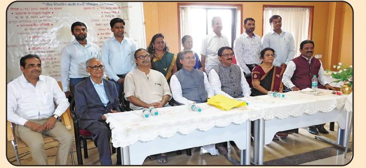
બ્રાહ્મી લિપિ પ્રશિક્ષણ કાર્યશાળા અતિથિ

આ કાર્યશાળામાં ડોક્ટર, ઇન્જિનિઅર, પુરાતત્ત્વ વિભાગ, ઇતિહાસ વિગેરે અલગ અલગ ક્ષેત્રોના સહયોગી ઉપસ્થિત રહ્યા હતા. ત્રણ દિવસની